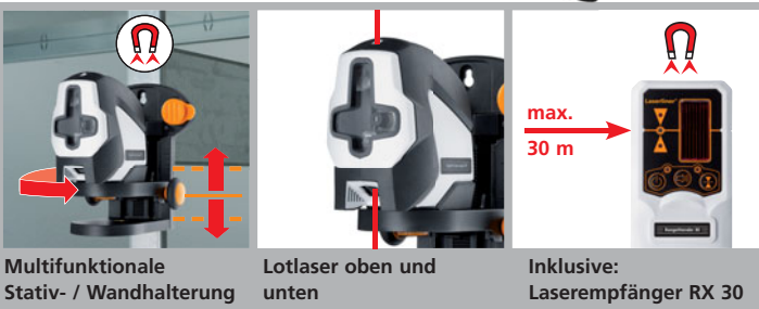
Multifunktionale Stativ- / Wandhalterung