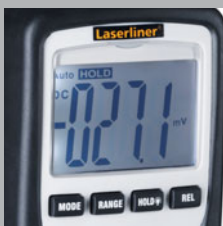
Großes, beleuchtetes Display