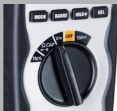
Einfach zu bedienender Funktionsknopf