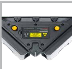
Anlegekanten und Auflagefläche