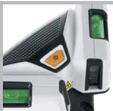
Libellen zur Justierung des Gerätes