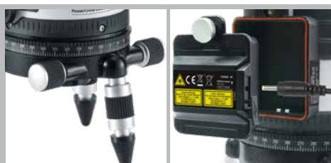
Robuster Metallsockel mit Seitenfeintrieb