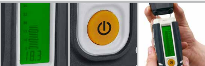
Großes, übersichtliches LC-Display

ABMESSUNGEN (B x H x T) 58 mm x 155 mm x 38 mm