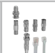
Vielfältige Adapter für Steckverbindungen