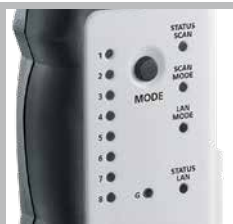
Zuordnung der einzelnen Leiter bei LAN-Netzwerkkabel