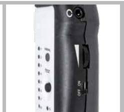
Regelbare Lautstärke der Prüfsignale