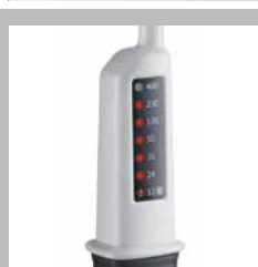
Display a LED ad alto contrasto