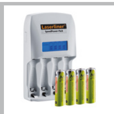
Högkvalitativ extern snabbbladdare