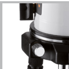
Robust metallsockel med drivenhet för fininställning i sidled