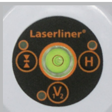
Belyst libell för förjustering