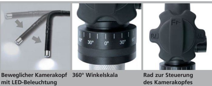
Beweglicher Kamerakopf mit LED-Beleuchtung