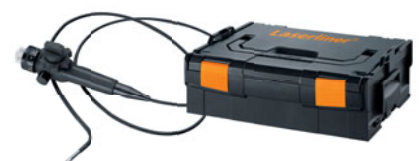
Flexi3D-Camera inkl. Sortimo® L-BOXX® 136

Verpackungsgröße (B x H x T) 442 x 151 x 357 mm