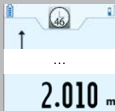
Timerfunktion zum automatischem Auslösen der Messung