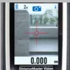
Viewfinder zum Anvisieren des Messbereichs

* Bereichsspezifische Genauigkeiten siehe Bedienungsanleitung. ** bei max. 10.000 lux *** In Verbindung mit 360° Neigungssensor