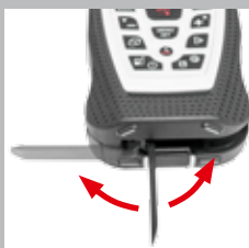
Klappbarer Pin für Messungen aus der Ecke