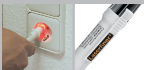
Indicateurs à LED