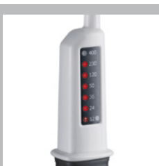
Écran à DEL riche en contraste