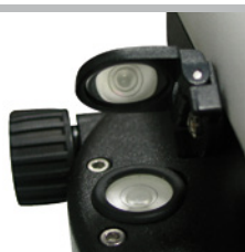
Miroir rabattable garantissant un alignement simple