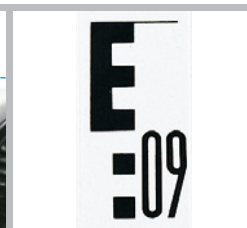
Vue de l'échelle avec division en E