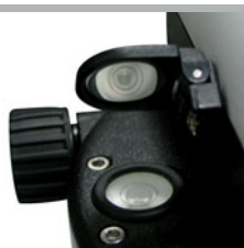
Miroir rabattable garantissant un alignement simple